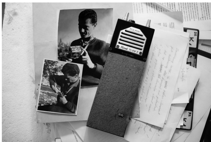
Zdjęcie –fotomontaż z Wojciechem SP5FM i „Klimkiem”